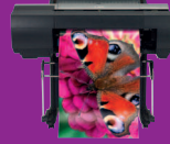
iPF6450 con opción de espectrofotómetro