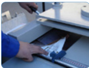
Hendido de los pliegos