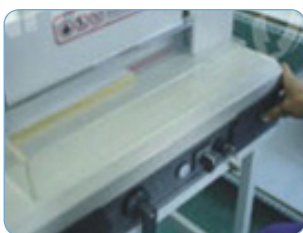
Guillotinado (refilado del álbum fotográfico)