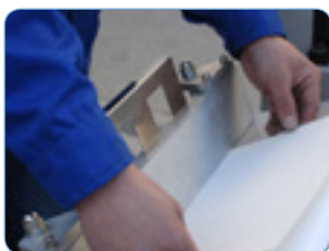
Montaje pliego contra pliego