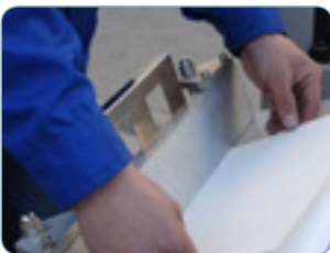
Montaje pliego contra pliego