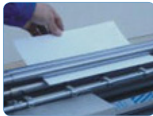
Encolado de cada pliego (reverso)