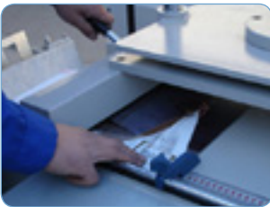
Hendido de los pliegos