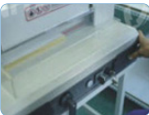
Guillotinado (refilado del álbum fotográfico)