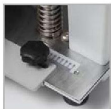
Ajuste de profundidad