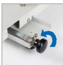
Mando giratorio con 6 preajustes de perforación