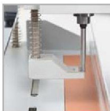
Broca y base