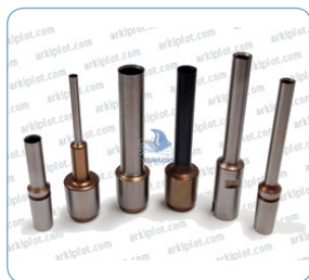
Brocas de 3 a 8mm