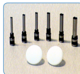
Brocas de 3 a 8mm y bases de corte